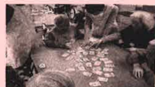
かるた取り: 何枚取れるかな