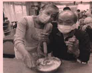
おやつレク いももち作り