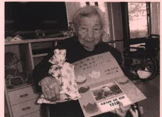
「誕生会: 101歳 元気いっぱいです」 おやつレク 柗ヶキ ふんわり