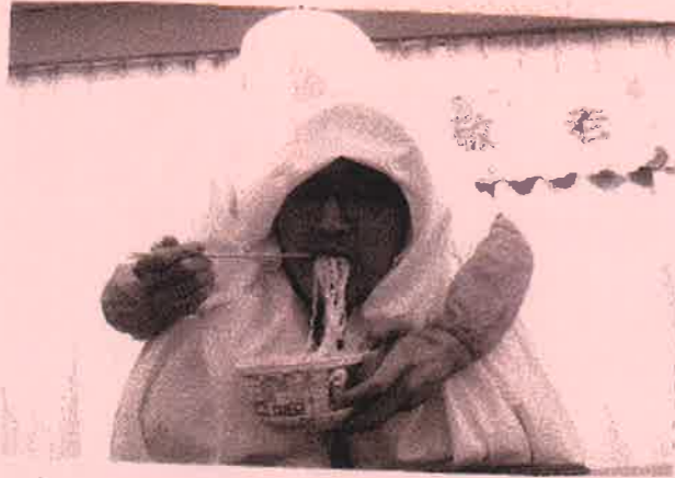
「二人羽織：おいしくいただきましたか」