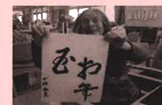
お正月 書初め いい年になりますように