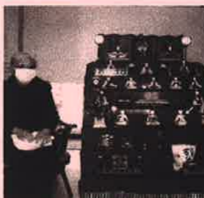
ひな祭り 並んで写真に