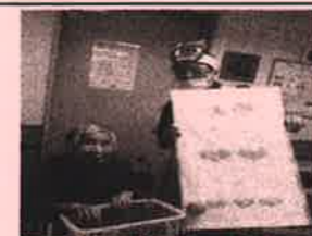
節分 いくつ付くかな