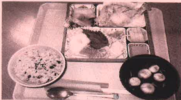
「赤飯もついて盛り沢山でした」