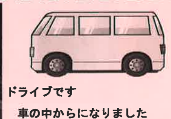
ドライブです 車の中からはなりました