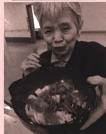
「お食事会 出前・美味しそう」