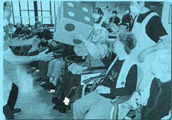
「大きなサイコロをエイッ」