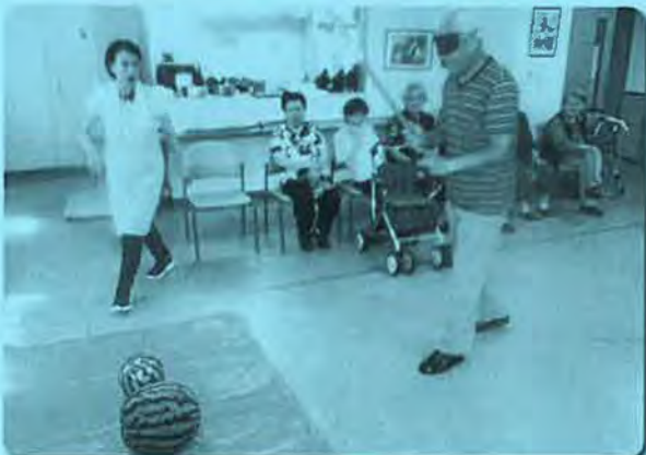
「狙いをさだめて、エイッ」