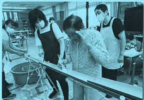
「うまくつかめるかな？」